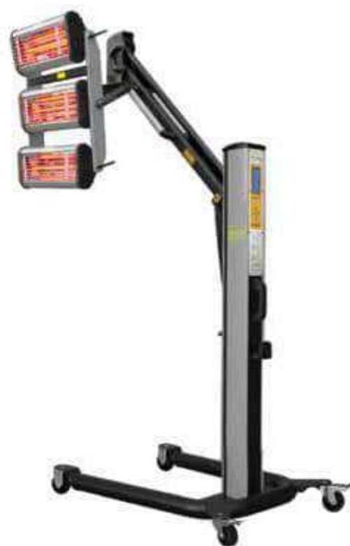
Sensor de distancia e Sensor de temperature